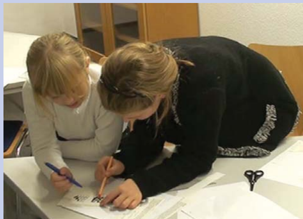
Kinder bei der Aufgabenbearbeitung in 2er-Gruppen.