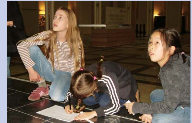
Kinder bei einer Rallye durch die Uni.

Zusammen mit wissenschaftlichen Mitarbeitern der Mathematikdidaktik und ausgebildeten studentischen Übungsleitern treffen sich die Schüler einmal wöchentlich in den Räumen der Leibniz Universität Hannover (Welfengarten 1), um in Paaren und Kleingruppen an mathematischen Problemstellungen zu tüfteln und zu knobeln.